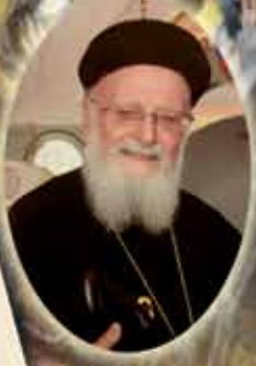
القدس أغسطينوس حنا

٦ - رأينا أبولوس للمرة الأخيرة عندما كان يزكيه بولس الرسول العظيم مع زيناس (الحامى) لدى تيطس (٣ : ١٣) والذي كان وقتها فى رحلة تبشيرية فى جزيرة كريت ويرى بعض علماء الكتاب المقدس أن أبلوس كان هو حامل لرسالة بولس الرسول إلى تيطس.