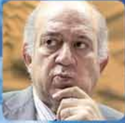
بقلم الدكتور طارق حجي